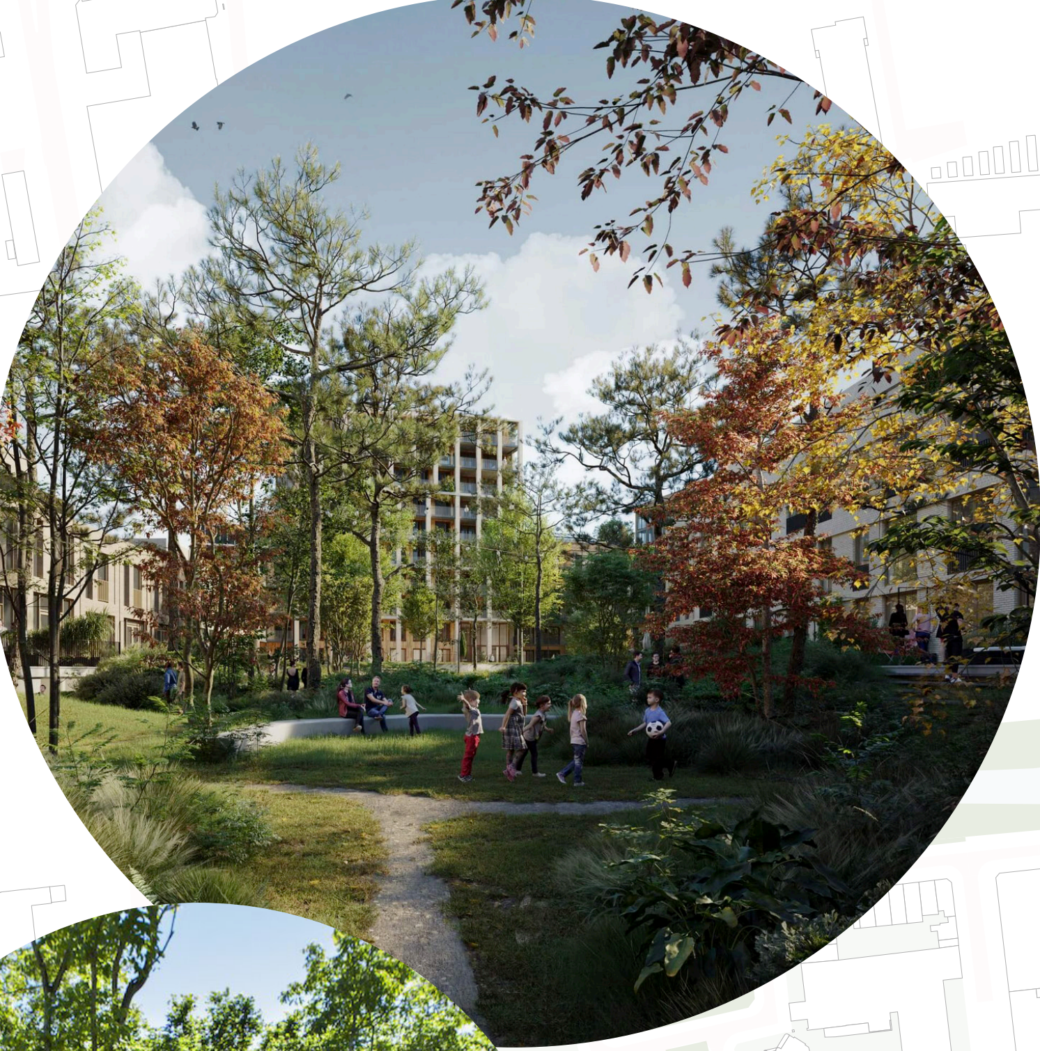
PARKSTAD, ROTTERDAM ORANGE ARCHITECTS

Na een lange werkdag maak ik graag een wandeling vanaf het Centraal station naar huis. Mijn wandeling brengt mij langs leuke, groene straten, parkjes en prachtige tuinen. Zo kan ik even de benen strekken na een lange treinrit en kom ik helemaal tot rust in de groene oases. Onderweg pluk ik een bloemetje voor op 'tafel bij de 'Pluktuin', neem ik verse groenten mee uit het voedselbos bij het 'Wijkbos' en haal ik een snelle koffie bij 'De kleine oase'. Uiteindelijk spreek ik met een buurtbewoner af bij 'Acadmiëpark' om met een borrel de wandeling af te sluiten. Wat heerlijk al die rustige groene oases in mijn intens drukke stad!