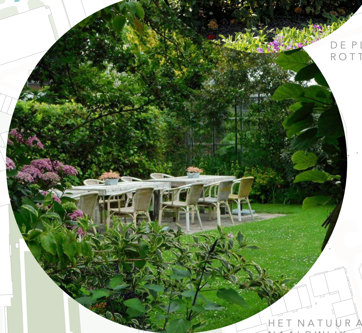
HET NATUUR ATELIER, NAALDWIJK