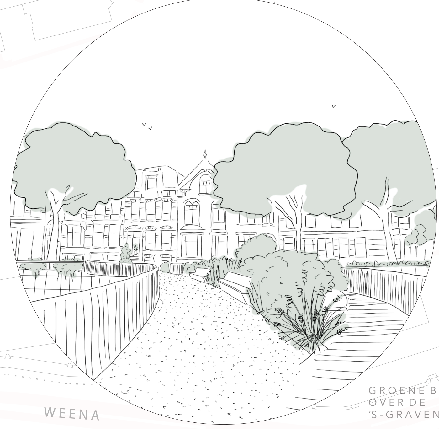
CENTRAAL STATION ROTTERDAM