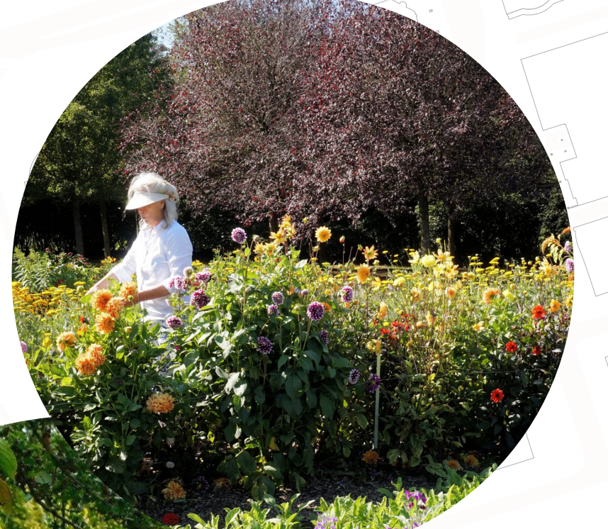
DE PLUKTUIN ROTTERDAM