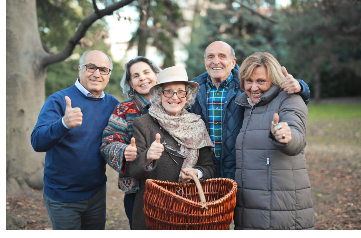
Samen met een gezamenlijk doel aan het werk op het land