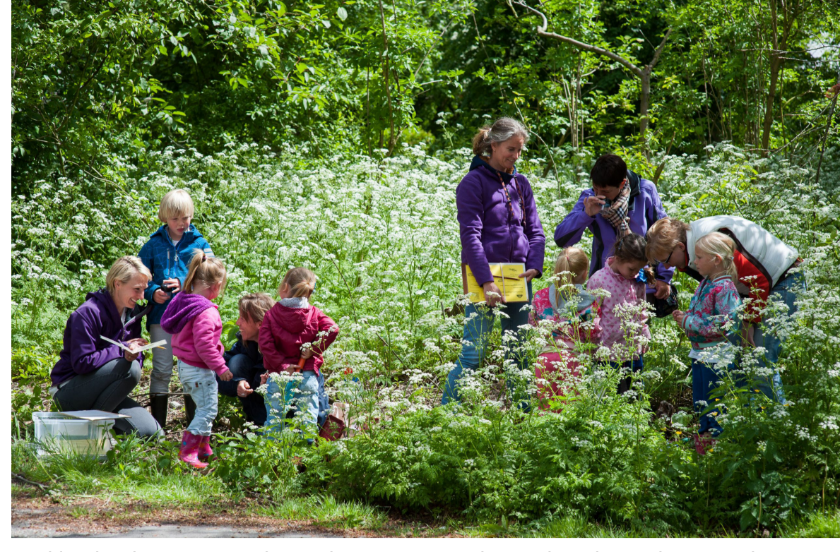
De kleinkinderen zijn op bezoek en oma vertelt uitgebreid over haar werk