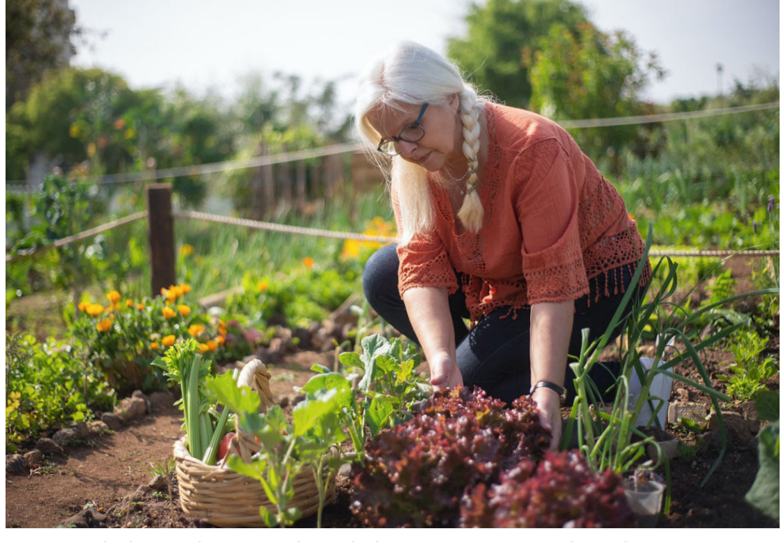
Er gaat niks boven het gevoel van koken met je eigen gekweekte groente