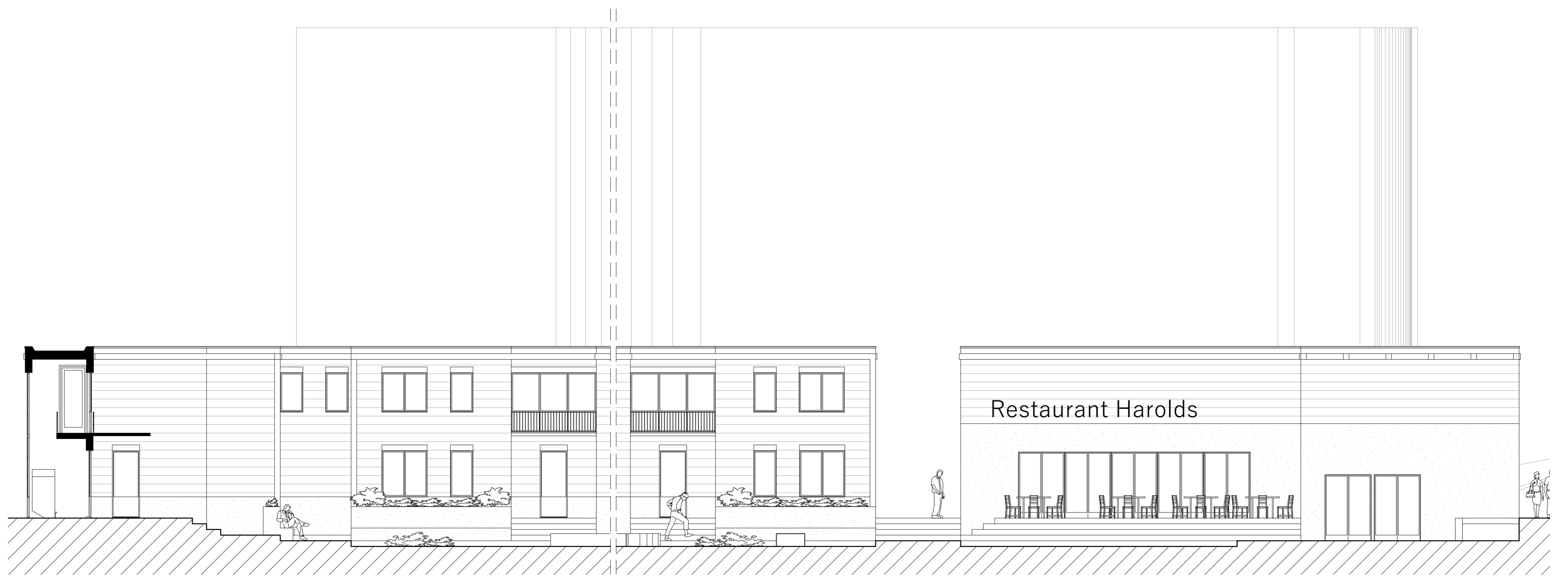
Doorsnede schaal 1:100