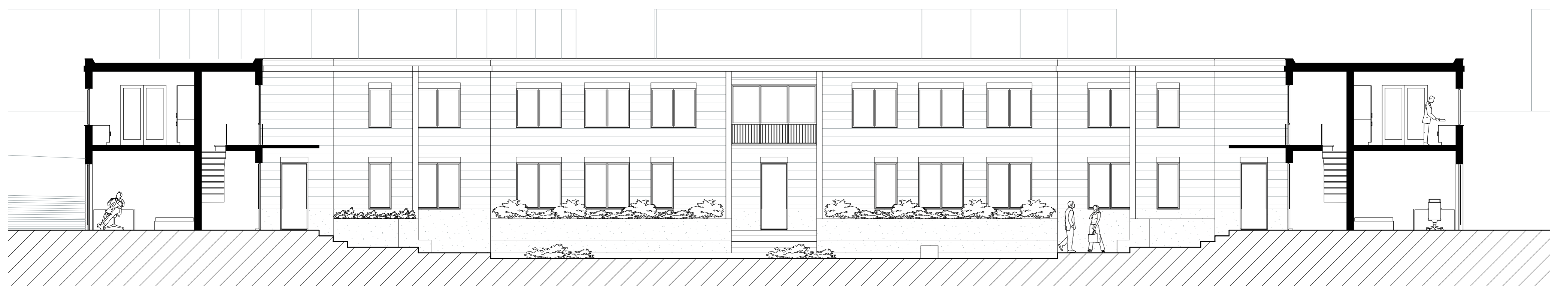
Doorsnede schaal 1:100