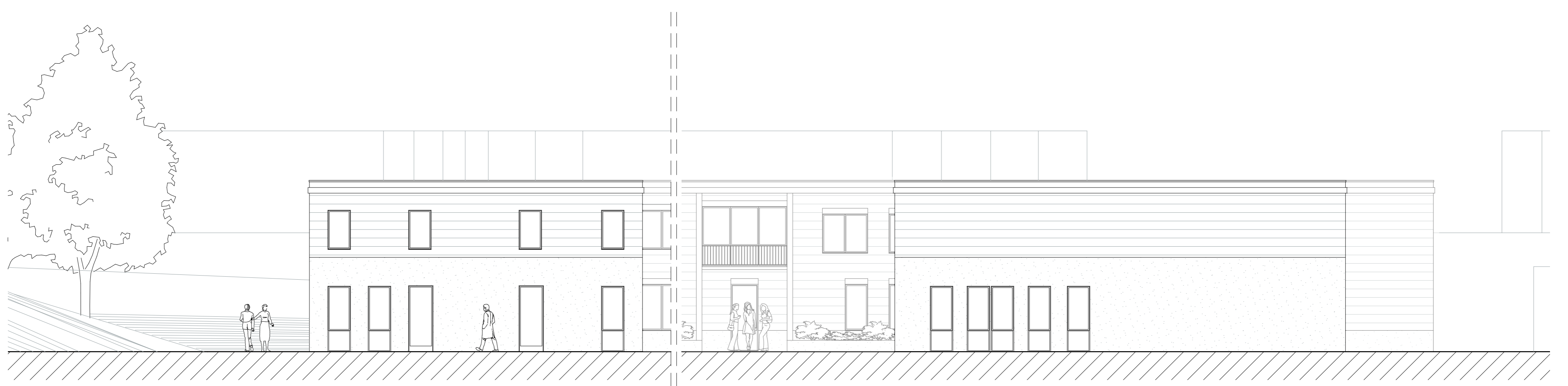
Capelsebrugpad zijde schaal 1:100