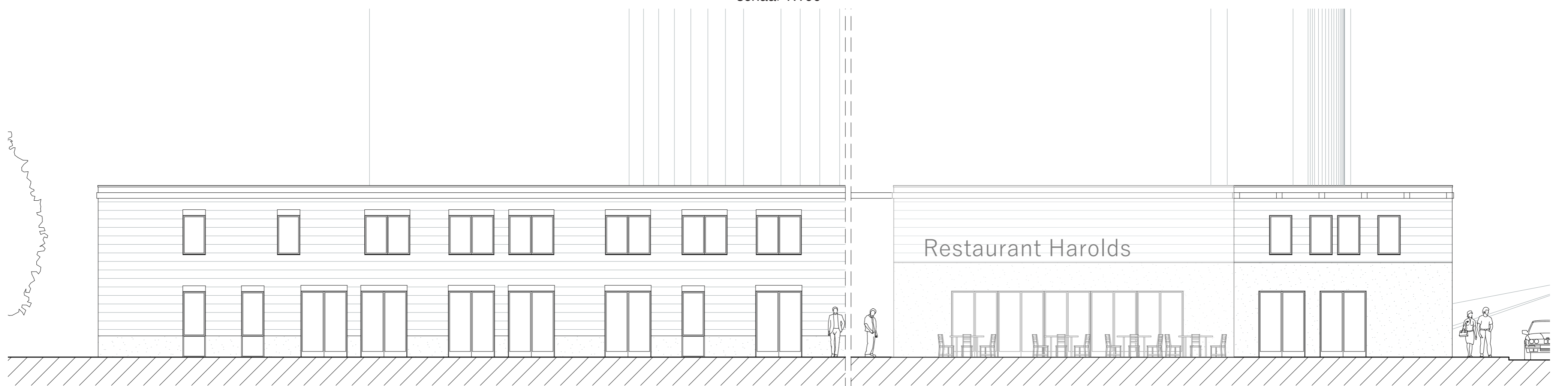
Abram van Rijckevorselweg zijde schaal 1:100