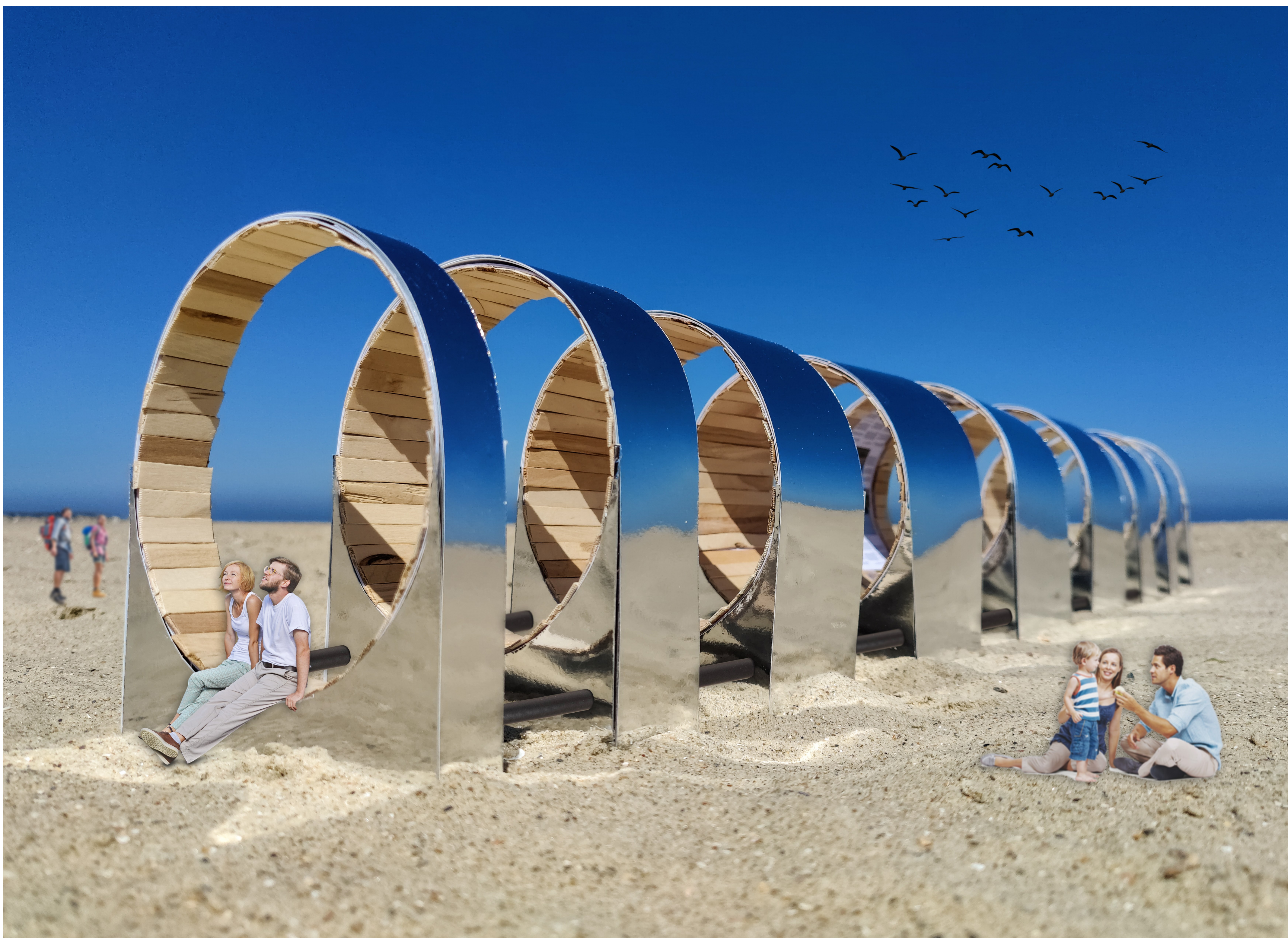
De 1:20 maquette in de omgeving; op het strand