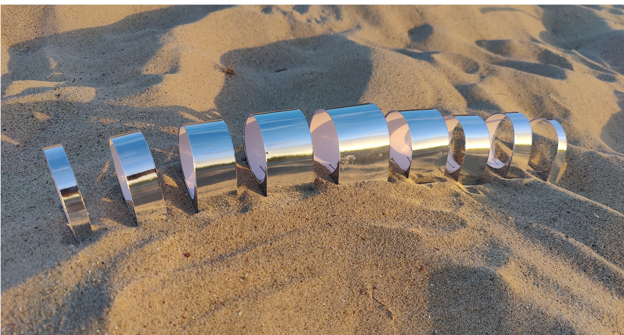
De 1:50 maquette in de omgeving en bij zonsondergang