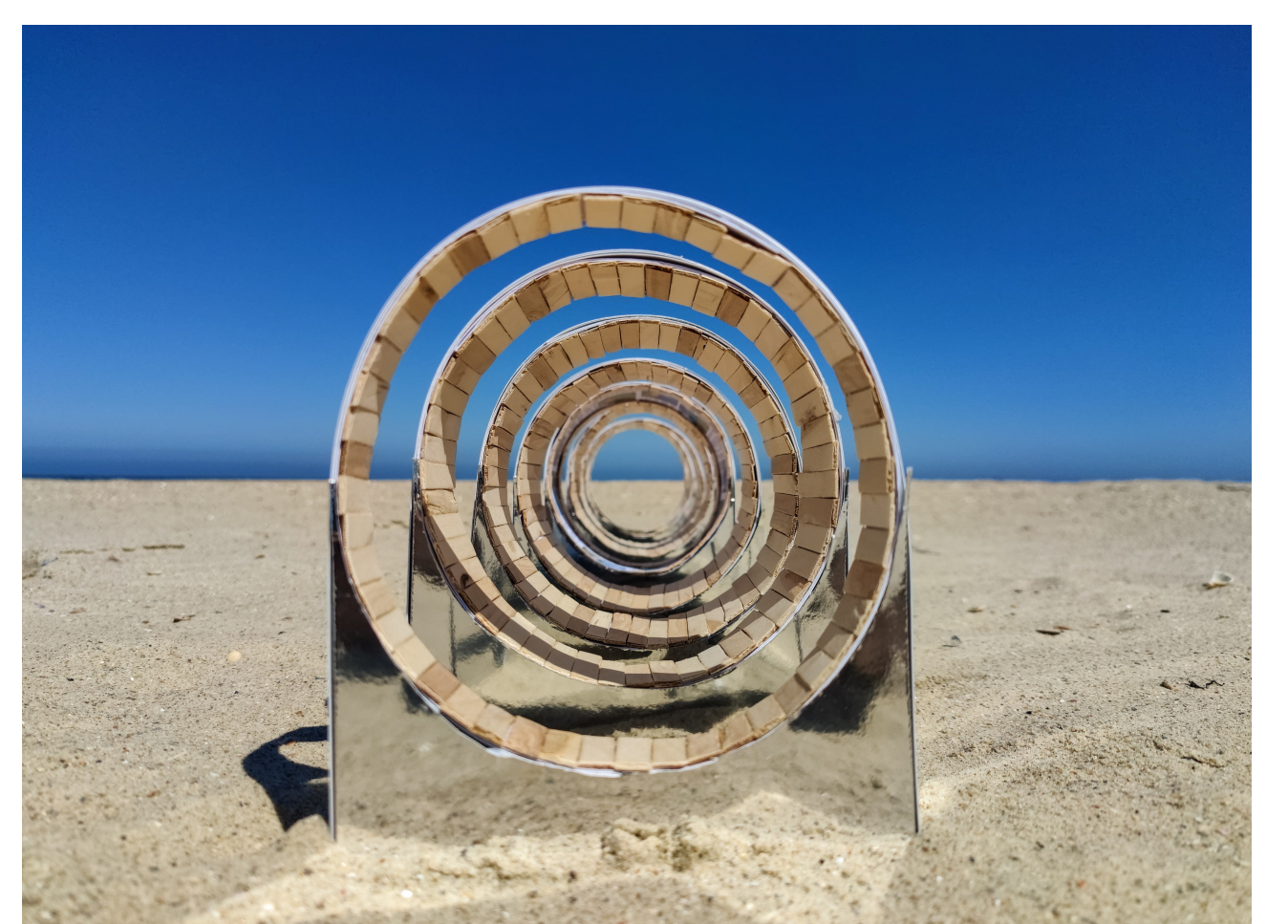
De evolutie van het ontwerp