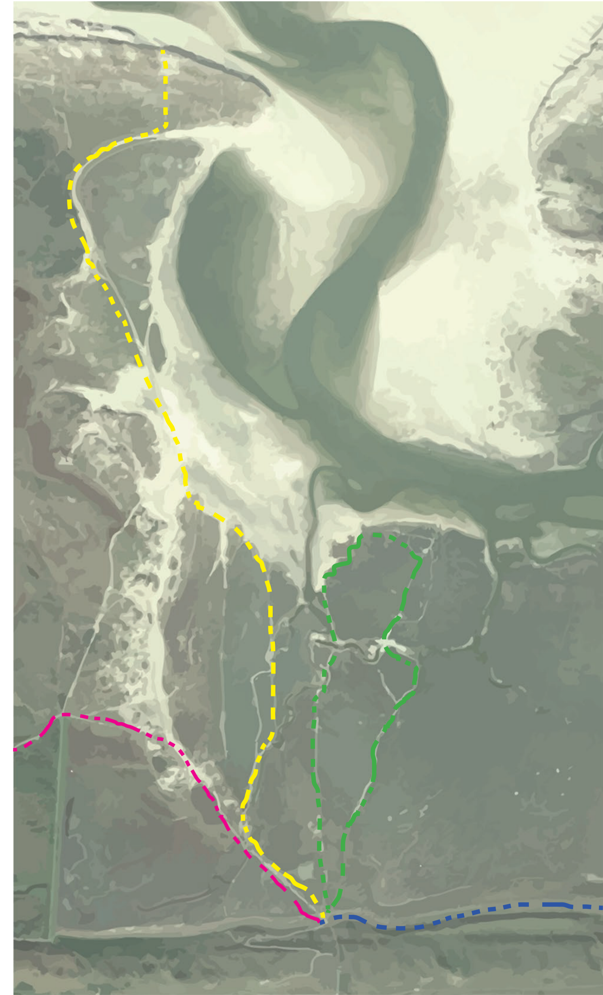
Wandelroutes Slufter Gebied