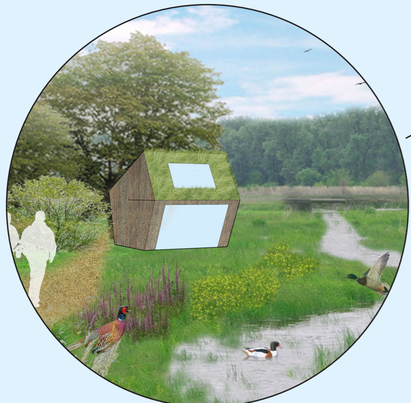
Hüsie De Slufter