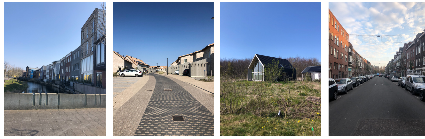
In alle ontwerpkeuzes staat de collectieve ruimte centraal.