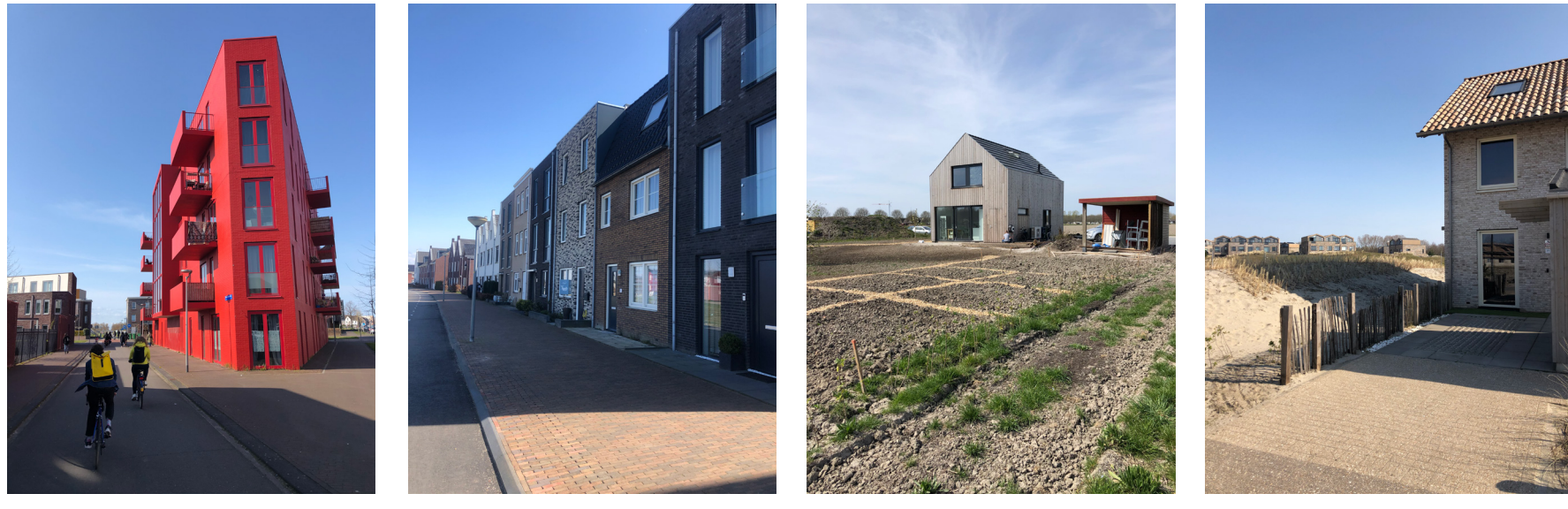
Het gebouw straalt optimaal de identiteit van de bewoner, haar functie in de gemeenschap en haar levensfilosofie uit.

Als deelnemer aan de studio 'Het ontworpen concept' maakte ik deel uit van een groep pioniers die een eerste vestiging in Almere-Pampus hebben ontworpen. We hebben gezamenlijk een basis gelegd voor een nieuwe dorpskern. Omdat de pioniersvestiging streeft naar zo veel mogelijk autonomie, zullen veel van de noodzakelijke voorzieningen door ons als pioniers zelf moeten worden gerealiseerd. Iedere deelnemer heeft daarvoor een klein gebouw voor een relevante publieke functie voor de pioniersvestiging ontworpen. Dit gebouw heb ik, als verantwoordelijke voor mijn functie, zo ontworpen dat ik er ook zelf kan gaan wonen.