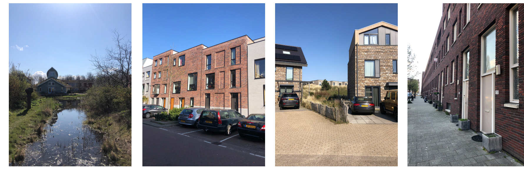
Zoek voor iedere ontwerpbeslissing een aanleiding in de directe omgeving.