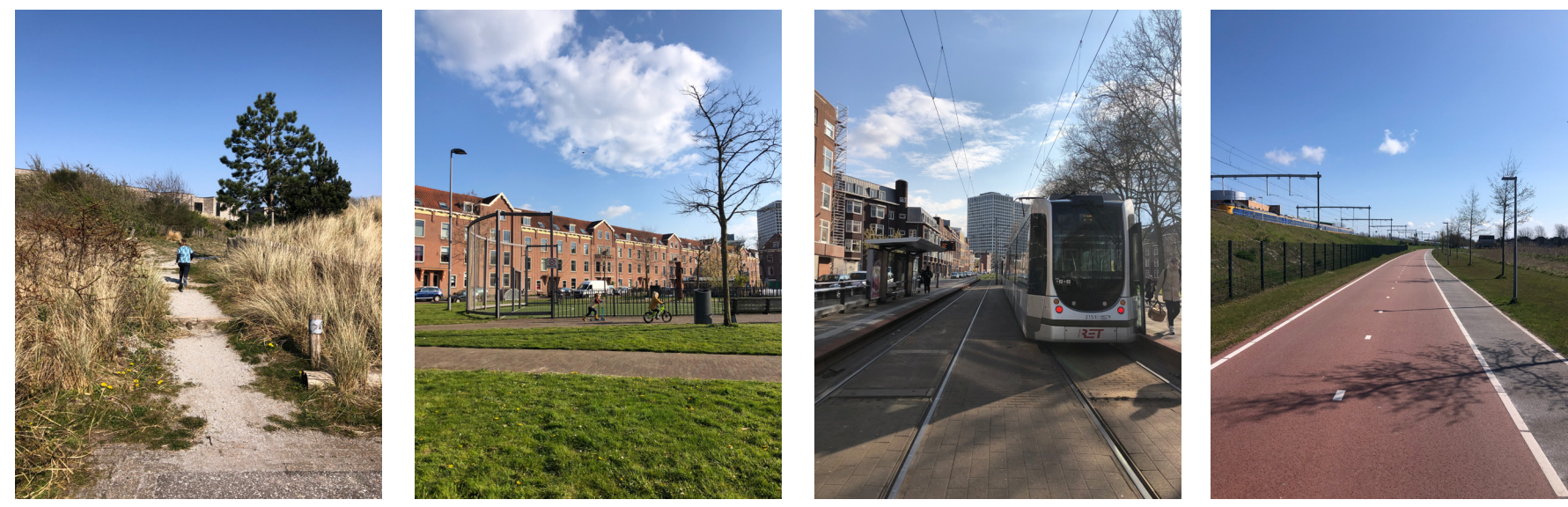
Ik definieer niet alles maar laat ruimte over voor de vrije interpretatie. Hierbij richt ik me enkel op de verbindingen door gebieden heen en niet op de volledige inrichting daarvan.