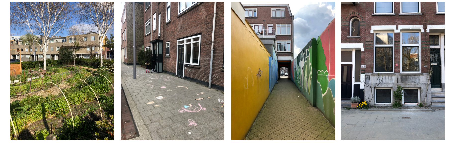
Zoek verschillende elementen om die met elkaar te verbinden.