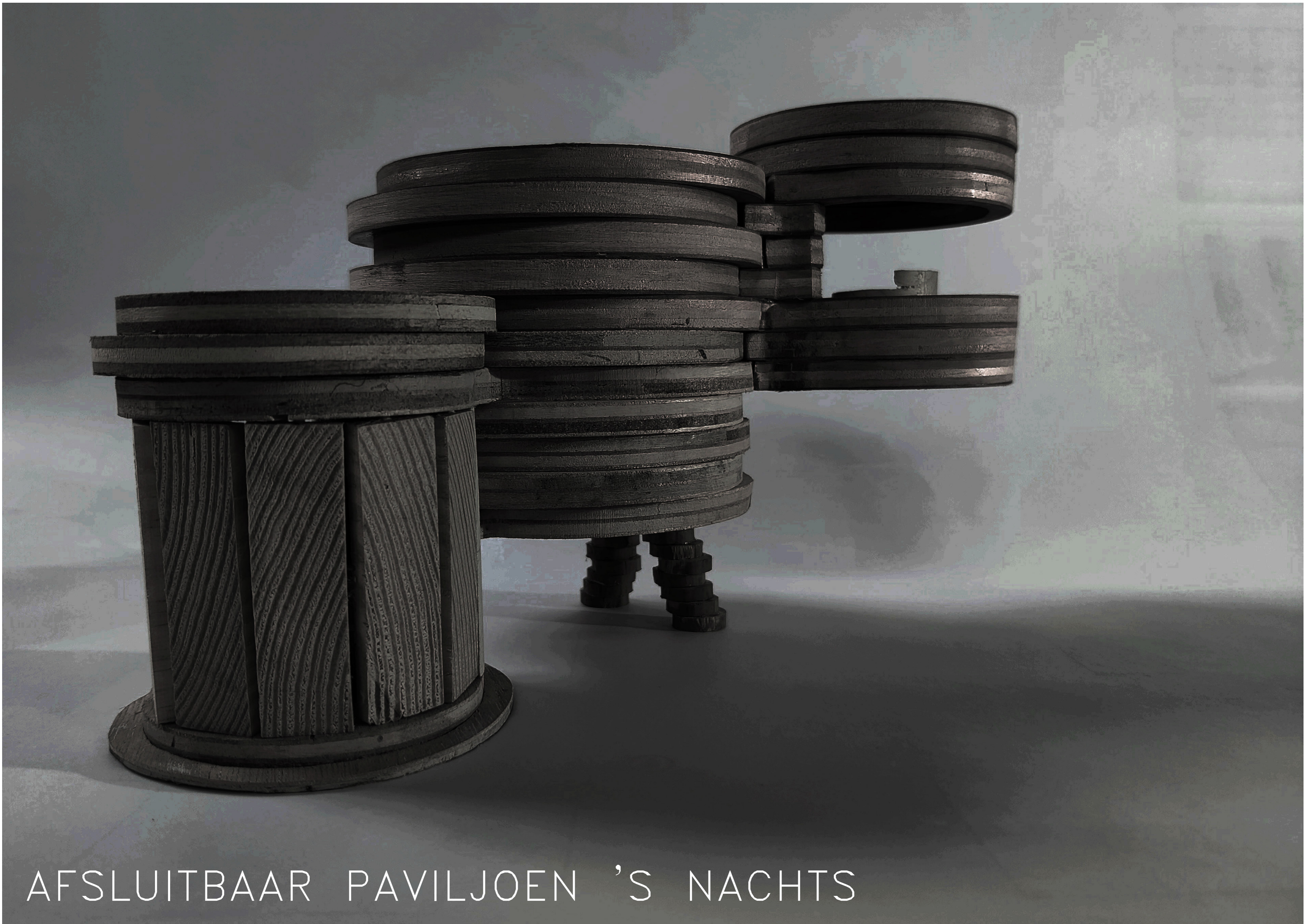
AFSLUITBAAR PAVILJOEN 'S NACHTS