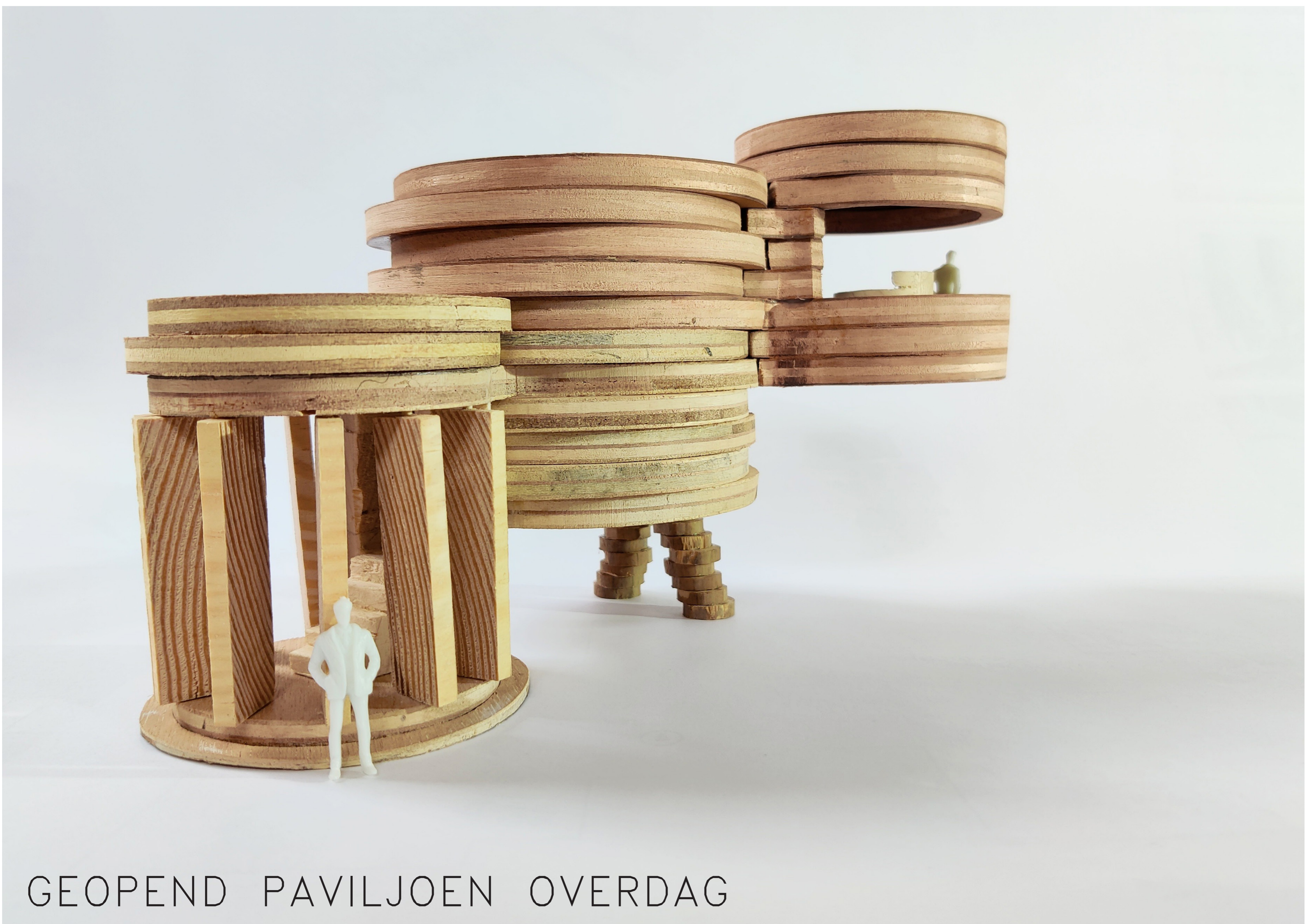
GEOPEND PAVILJOEN OVERDAG