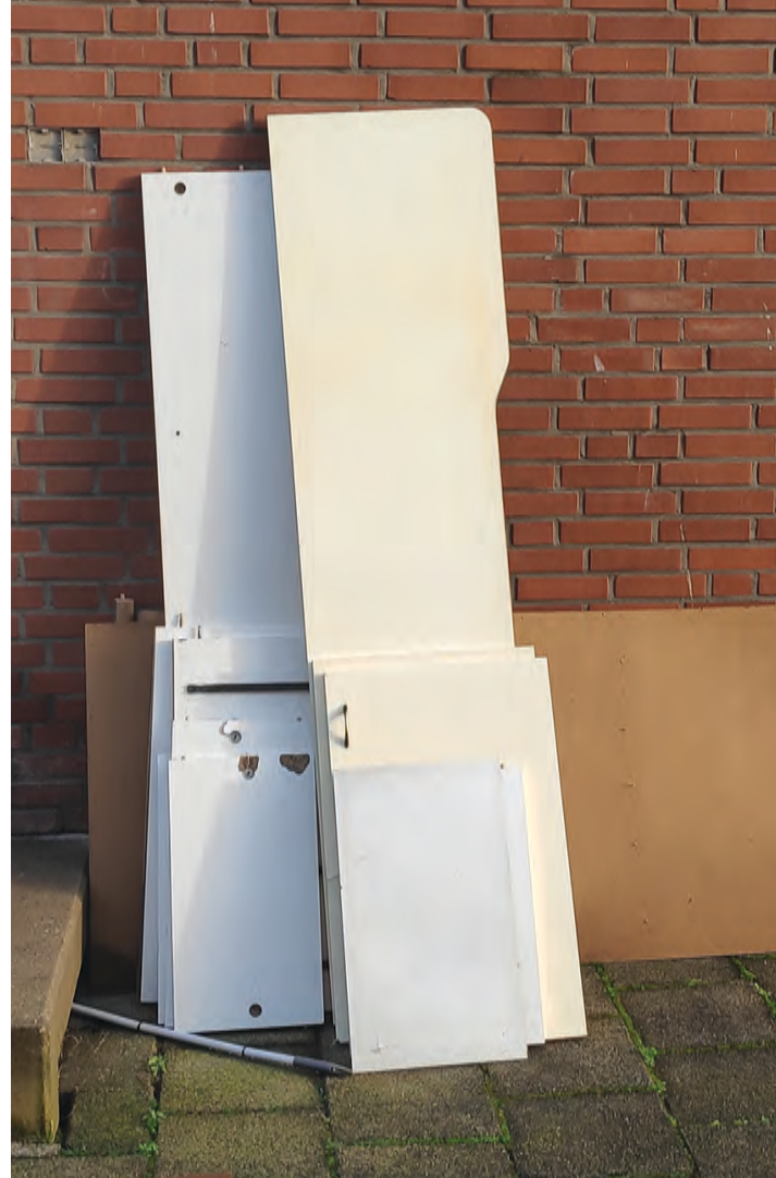
In oud mathenesse ligt veel afval op straat -