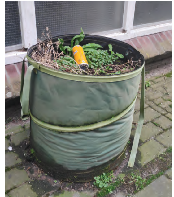
plantenbakken uit banden, een stoel gemaakt van oude spijkerbroeken, haringzakken voor hangplanten en een oude ikea mand van ikea als plantenbak (en onbedoelde prullenbak).