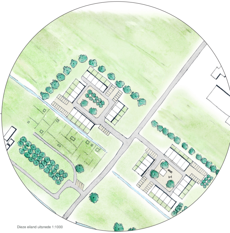
Dieze eiland uitsnede 1:1000