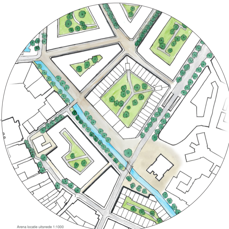
Arena locatie uitsnede 1:1000

ERTVELDPLAS - De Ertveldplas ligt tussen centrum en hoogwaardige natuur. Momenteel is deze route, van centrum naar de noordelijk gelegen natuur, lastig af te leggen. Met het voorstel voor het wonen aan de Ertveldplas is er ruimte gelaten voor een structuur die de beweging van binnenstad naar hoogwaardige natuur faciliteert. Met enerzijds water en aan de andere zijde het spoor, is er naar beide kanten een formele wand gecreëerd. Deze formele rand wordt aan de spoorzijde versterkt door een dubbele bomenrij. Het binnengebied is daarentegen informeel van karakter.