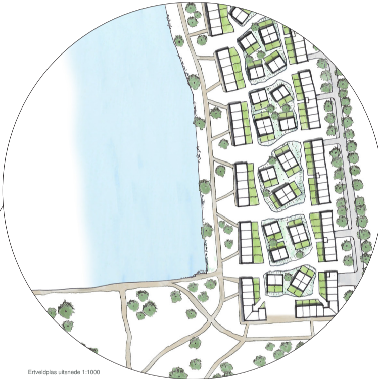
Ertveldplas uitsnede 1:1000

DIEZE EILAND - Ten noorden van Den Bosch ligt het natuurgebied Dieze Eiland. Met slechts een aantal boerderijen is het gebied voornamelijk natuur en akkergrond. Door de nieuwbouw in te passen aan de hand van bestaande structuren, denk aan de sloot- en boomstructuren, blijft de landschappelijke kwaliteit zo veel mogelijk bewaard. Door middel van erven worden kleine buurtjes gecreëerd op het Dieze Eiland. Deze buurtjes worden allemaal ingesloten door, dan wel een bestaande structuur zoals de sloten, of door een boomstructuur. Temidden van de erven is er ruimte voor collectief gebruik, bijvoorbeeld een speeltuin of boomgaard.